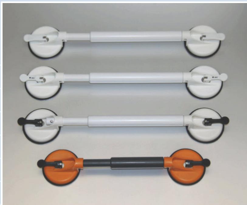
Historisk oversikt: Utviklingen av Mobeli støttehåndtak.

For nesten 10 år siden introduserte ROTH GmbH sitt mobile støttehåndtak på hjelpemiddelmarkedet. Oppfinnelsen er basert på det faktum at et vakuum (et nesten lufttomt rom) har en enorm styrke. Ingeniørene ved ROTH utviklet en serie av mobile støttehåndtak og andre praktiske hjelpemidler. Slik ble Mobelisystemet født.